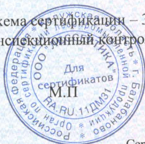
Схема сертификации – 3с. Инспекционный контроль – октябрь 2021 года, октябрь 2022 года.